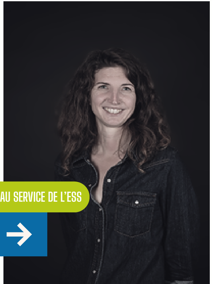
Déléguée Générale Adjointe - RTES